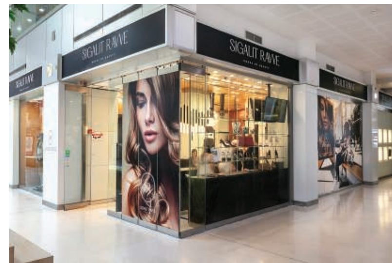
סיגלית רווה- המרכז הישראלי לטיפולי אסתטיקה הוליסטית.

לפני שנתיים, בגיל 50, החלטתי להגשים את חלומי ולחבר בין שני העולמות האהובים עלי בריאות ואסתטיקה בקליניקה ייחודית, עבור נשים בוגרות המרגישות עדיין